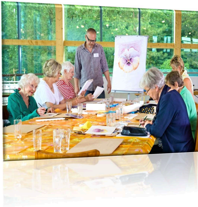
Figuur 4 Fonds Sluyterman van Loo: stimuleert het levensplezier van ouderen door kunst en verbinding

In 2026 biedt het wooncomplex Nieuw Akerendam, gelegen naast de buitenplaats Akerendam, toekomstbestendige huisvesting van ouderen. De rol van Stichting Sluyterman van Loo daarbij is op dit moment ter nadere invulling.