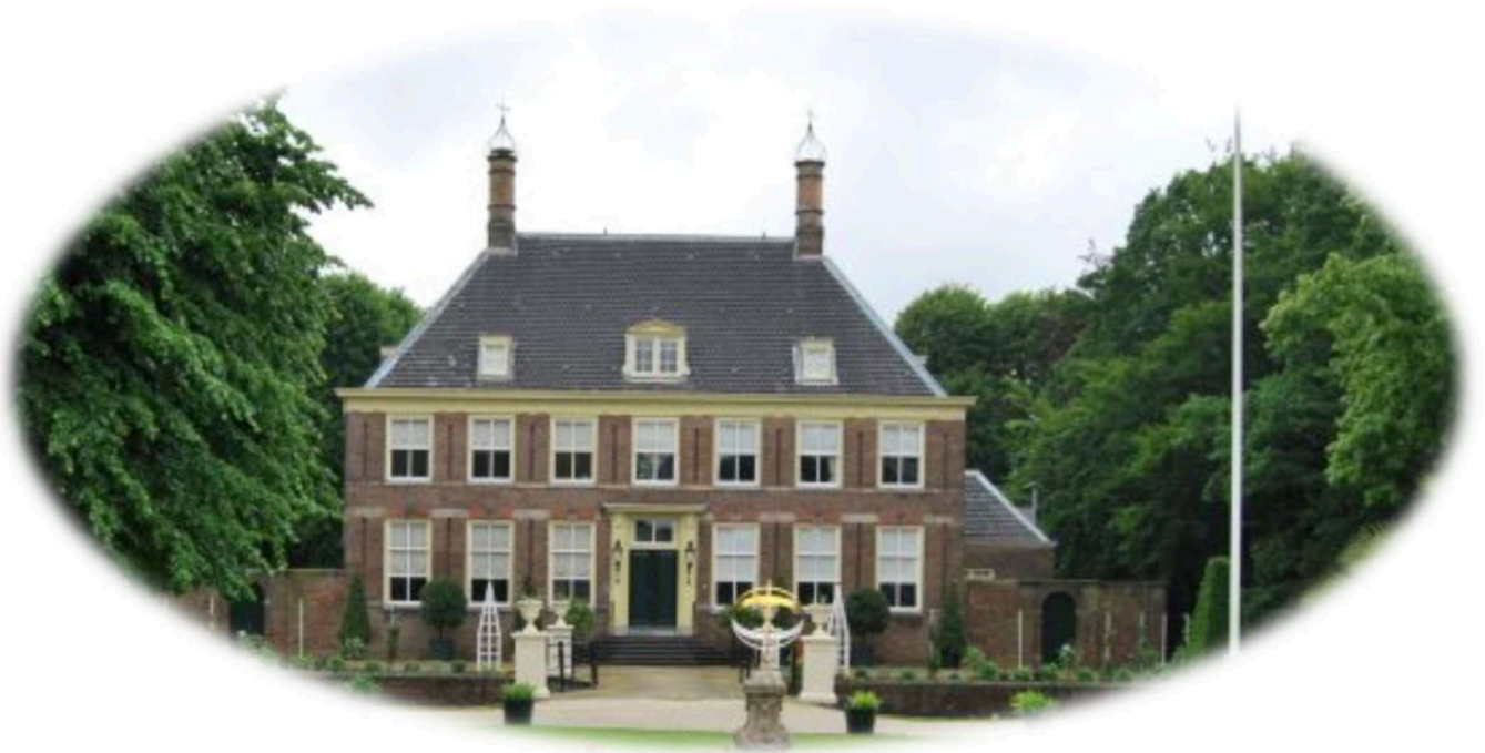
Figuur 3 Het huis van de buitenplaats Akerendam

Jaarlijks houdt FSvL een open tuindag in combinatie met open monumentendag. Ook wil Fonds Sluyterman van Loo een ouderenfestival (laten) organiseren, in combinatie met een open tuindag. Idealiter staat de komende jaren actieve kunstbeoefening centraal, zodat Akerendam ook een creatieve broedplaats wordt voor ouderen. De komende jaren staat verduurzaming van de buitenplaats ook op de agenda.