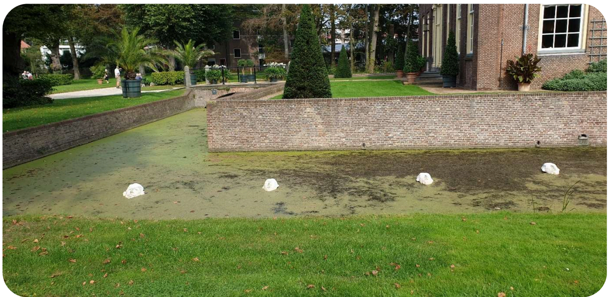
Figuur 1 Kunst op de buitenplaats Akerendam

Doelstelling: eind 2026 heeft ons fonds effectief en proactief bijgedragen aan het levensplezier van ouderen door kwalitatief hoogwaardige initiatieven te financieren voor kunstbeoefening (creatieve ontwikkeling) en voor duurzame dialogen en ontmoetingen (verbinding).